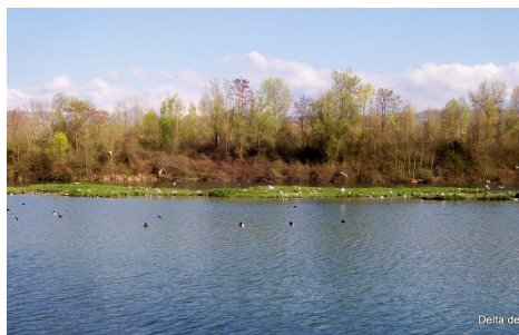
L'étang, réserve des oiseaux, vue du poste d'observation

A la découverte des espèces végétales de la réserve naturelle de la Dranse: randonnée avec Denis Jordan.